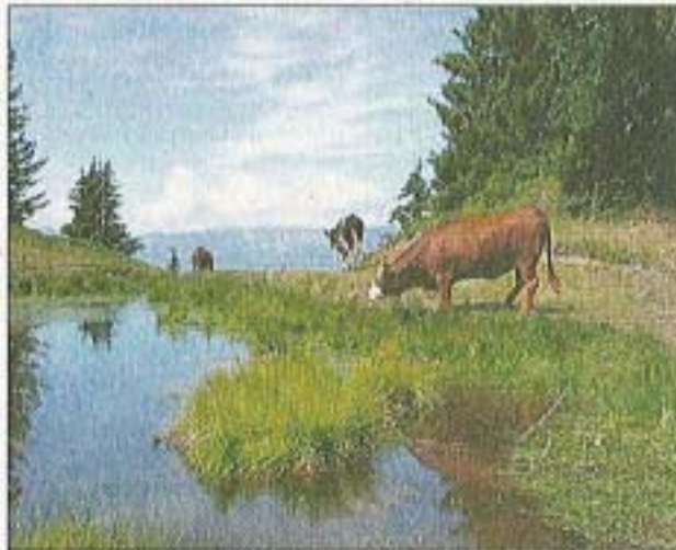
Le Crêt du poulet.