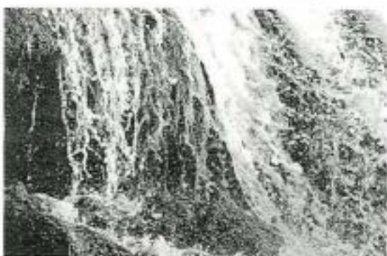
Le Sage est un document de planification pour les usages de l'eau.