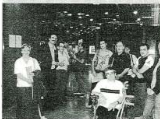
« Quelle eau voulons-nous pour 2020 ? » : à l'initiative de la Commission Locale de l'Eau (CLE) Drac-Romanche, 18 habitants du sud-Isère, membres de la conférence de citoyens, ont émis un avis sur les enjeux de l'eau à l'échelon local.

Présidée par le conseiller général de l'Isère, Charles Galvin, la Commission locale des eaux (CLE) Drac-Romanche est composée d'élus, d'usagers de l'eau et de représentants de services de l'Etat. Elle existe depuis 2002. Et elle travaille actuellement à la rédaction des préconisations et actions qui constitueront le cœur du Schéma d'aménagement et de gestion des eaux (Sage). A l'instar de ce qu'est le PLU pour l'usage du sol, le Sage est un document de planification pour les usages de l'eau. Ce Sage devra être finalisé en mars ou avril 2007 et présenté au vote de la CLE pour adoption. Il sera ensuite soumis à consultation avant promulgation par arrêté inter-préfectoral 6 à 12 mois plus tard. Rappelons que ce Sage couvre les bassins du Drac et de la Romanche et concerne ainsi 115 communes de l'Isère, 2 des Hautes-Alpes et 2 de Savoie. ■