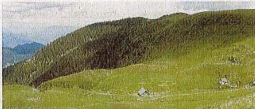
Une journée grand public sera consacrée à une découverte nature des Crêts d'Alleverd.

A l'occasion de son 20e anniversaire, Avenir, conservatoire des espaces naturels de l'Isère, organise dimanche 9 juillet une journée grand public de découverte nature des Crêts d'Alleverd (massif de Belledonne - communes de Saint-Pierre-d'Alleverd, Theys, La Ferrière, Les Adrets).